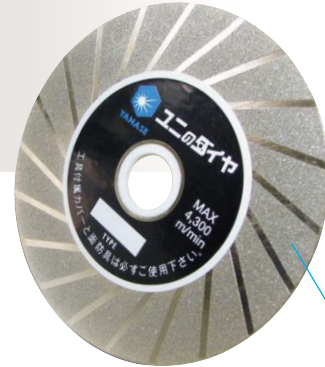
電着部厚0.8mm×電着部幅20mm