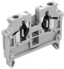
標準価格156円/1個 販売単位(100)