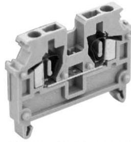
標準価格143円/1個 販売単位(100)