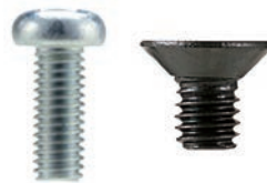
スペーサー取付用ビスセット MTシリーズ P1-173