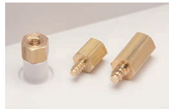
タッピングスペーサー TPSシリーズ P1-171