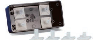
タッピングビス用貼付ボス ASRシリーズ P1-172