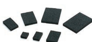
基板押さえスポンジ URシリーズ P1-174