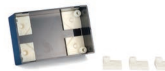
M3・M4インサートナット入り貼付ボス T-600・T-700 P1-172