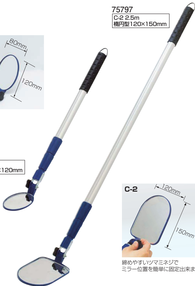
75797 C-2 2.5m 楕円型120×150mm