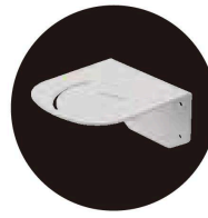
壁面取付ブラケット NH-WST2 オープン価格