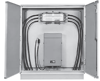
〔CATV用電源等組込み例〕

(注) ボックスの構造上、内部に雨水等が入りますので、 収納機器のご選定の際はご注意ください。