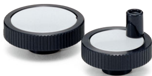
[HCS] アルミコントロールハンドル (P.334)