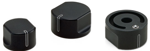
[ECK] アルミコントロールノブ