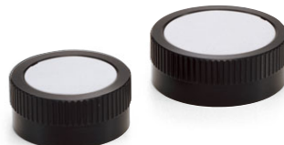
[HCB] アルミコントロールハンドル (P.335)