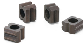
PIB インデントブロック