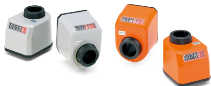
デジタルポジションインジケータ (P.368~P.369)