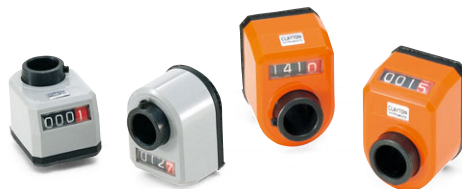
デジタルポジションインジケータ (P.370~P.371)