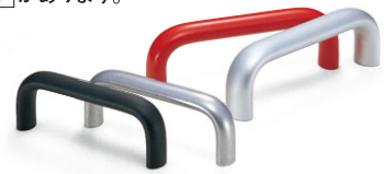
[UAF] アルミ取手 (P.216~P.217)