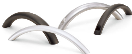
UARF UARC アルミアーチ取手