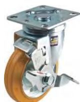
STC-125 CBCE S-2