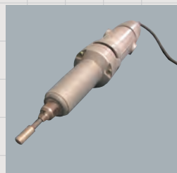
※ハンドグラインダー用