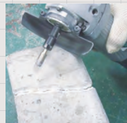
※コレットチャック(別売)でディスクグラインダーにもご使用いただけます。