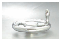
S-N + AS