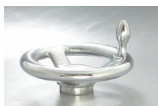
P-N + AS