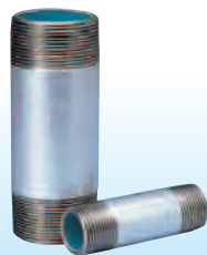
水道用ポリエチレン粉体ライニング鋼管製 PBパイプニップル 〔略号：PB-PNI〕