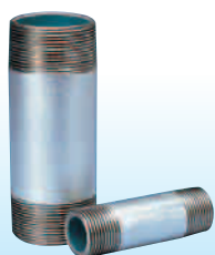
水道用硬質塩化ビニルライニング鋼管製 VBパイプニップル 〔略号：VB-PNI〕