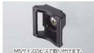
M5サイズのビスで取り付けます。