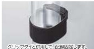
グリップタイと併用して、配線固定します。

グリップタイマウントベースは、グリップタイ(P75~77)と併用してケーブルを固定することができる、配線固定具です。ラックなどの穴に、M5サイズのビスでしっかりと取り付けることができます。また、ビス穴の座面が小さく、高さがあるため、通信ラックやテツガ(鉄架)上の狭いスペースでも取り付けることが可能です。面ファスナー式のグリップタイ*で結束するため、繰り返し使用できるほか、ケーブルの被覆を傷つけません。 *：グリップタイは別売りです。