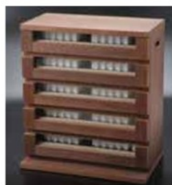
WS(ガラス窓付き) WS (wooden stocker with glass windows)

※ストックのみの別売もいたします。 ※Cabinets also sold individually.