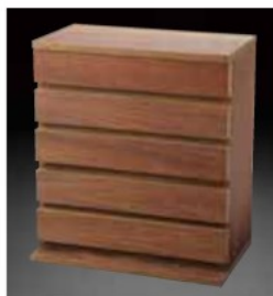
WS(ガラス窓なし) WS (wooden stocker without glass windows)

六角プラスチック ケース小が収納で きます。 外寸 W465×D280 ×H520mm ストック重量 約13kg Can hold small gauge hexagonal plastic cases. External dimensions are W465×D280×H520 and the weight is approximately 13kg.