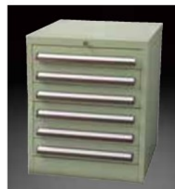
SS(スチールキャビネット) SS (steel cabinet)

※ストックのみの別売もいたします。 ※Stickers only is to be sold individually.