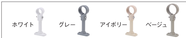
品番コード A10467 PP立バンドセット品 (SGP用) ホワイト 単位 (mm)